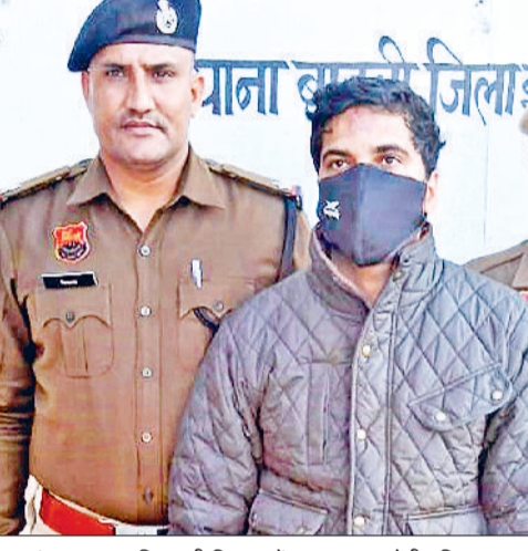
हिसार स्थित घर पर आए हुए थे। रविवार देर शाम को दोनों कार में सवार होकर गुरुग्राम के लिए निकले। बीच में कुछ देर के लिए वे हांसी में महक के मायके में भी ठहरे और फिर रवाना हो गए।