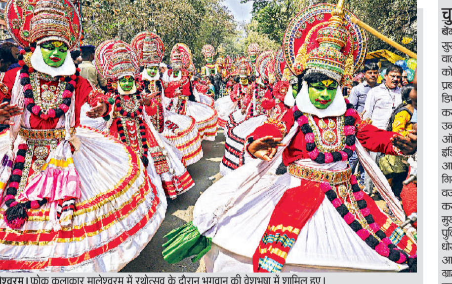
मलेशरम। फोक कलाकार मालेशरम में रथोत्सव के दौरान भगवान की वेशभूषा में शामिल हुए।